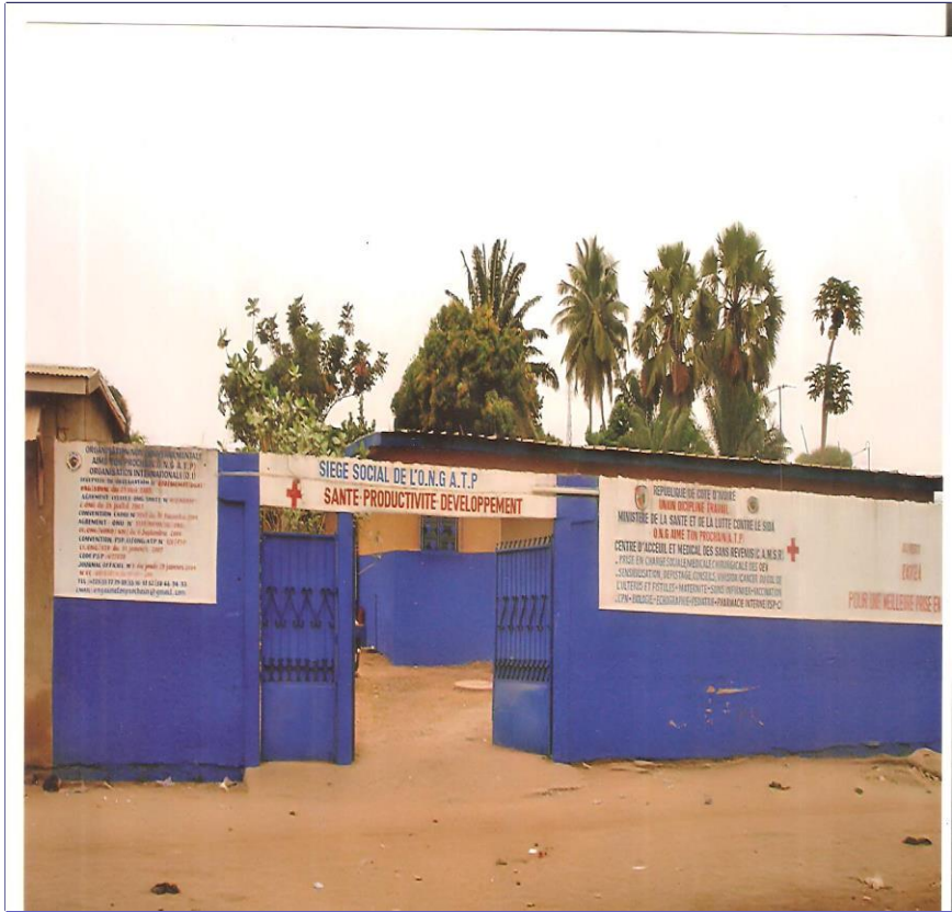
Siege social de l'ONG ATP Bouaké