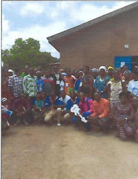
Ici photo de famille avec l'équipe de l'ONG ATP et la population d'Agbakro