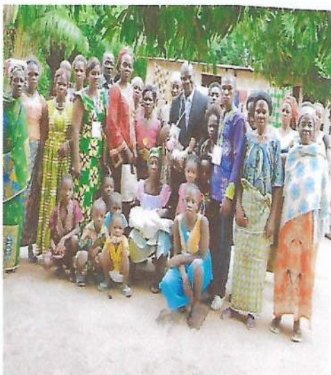
Ici photo de famille avec l'équipe de l'ONG ATP et la population d'Ahougnanssou