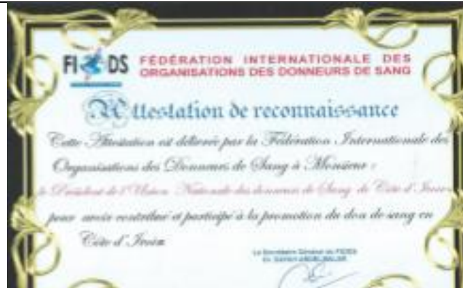
Attestation FIODS du mérite 100% de sang bénévole