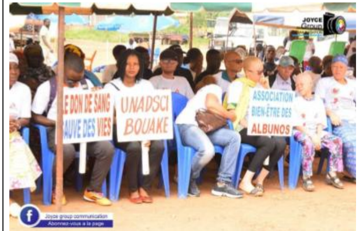
AU DON DE SANG, IL N'Y A PAS DE RACE