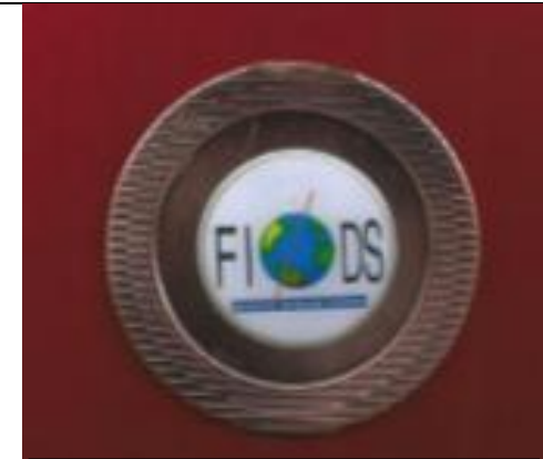
La médaille FIODS