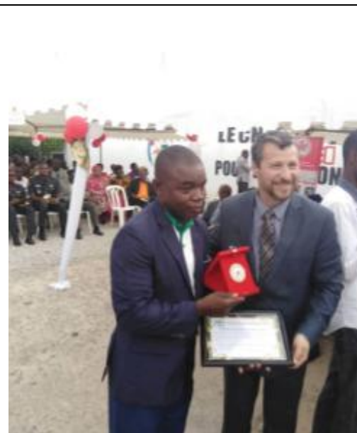
L'UNADSCI RECOMPENSE PAR LE S.G. FIODS