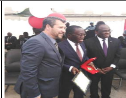
La FIODS le Ministère de la Santé et l'OMS (14 JUIN 2019)