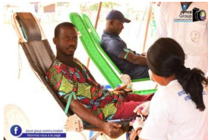
LE DON DE LA VIE SE FAIT TOUS LE JOURS