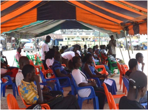
Place ELLENGANT ETCHE à ABOISSO NOE