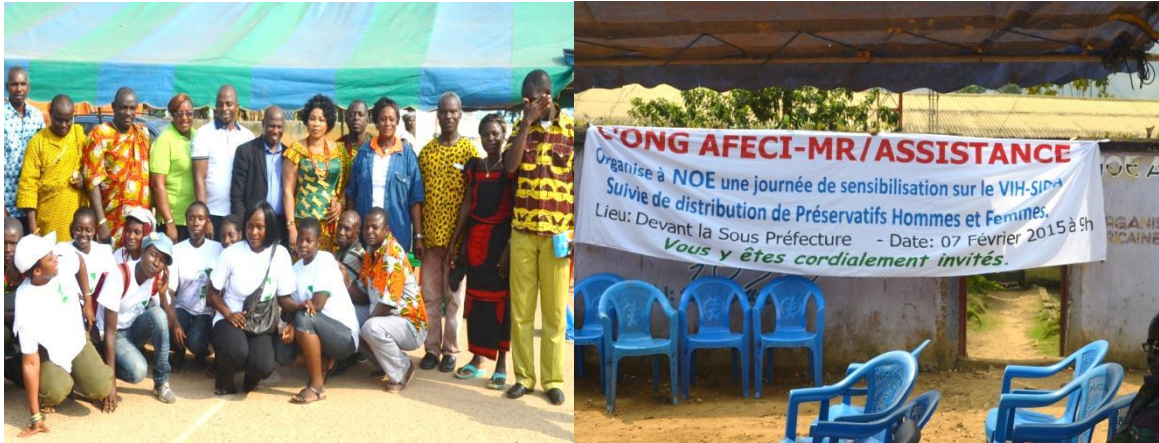
Photo de famille place ELLENGANT ETCHE