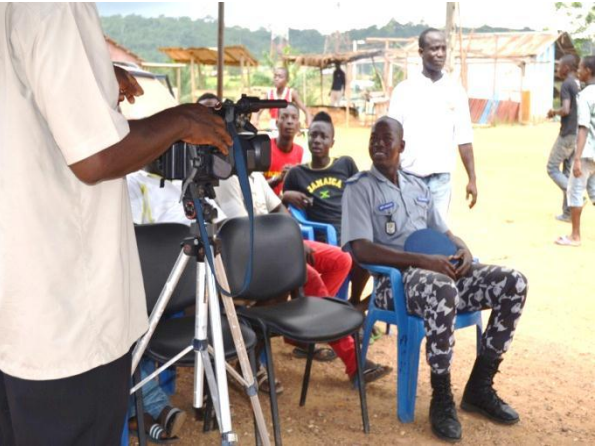
Face Sous/Préfecture de