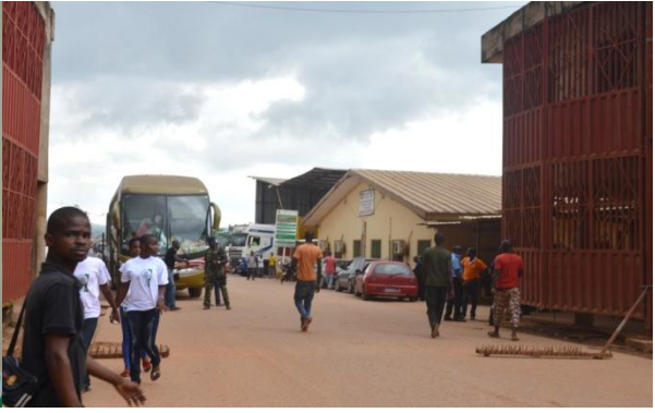
Corridor de NOE