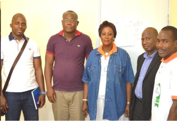
Commandant du corps urbain police cor de NOE POLICE DE NOE