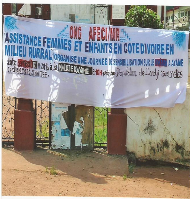
AFFICHE DE L'ONG