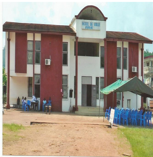
HOTEL DE VILLE D'AYAME, LIEU DE LA CEREMONIE