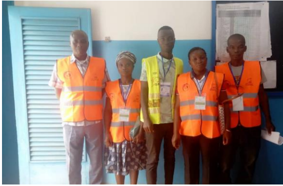
Agents de sensibilisation (A.S.C)