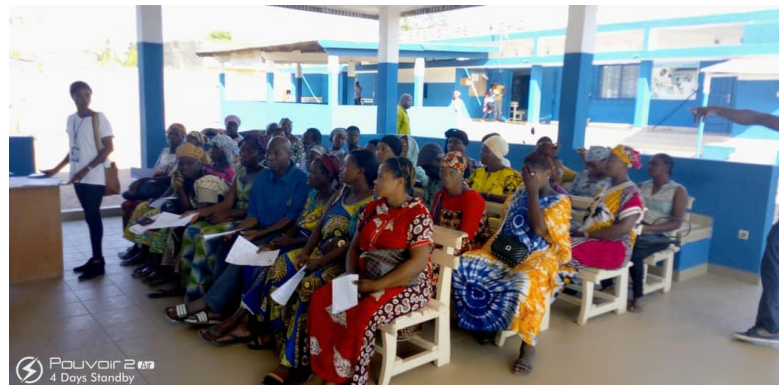
Patients en salle d'attente