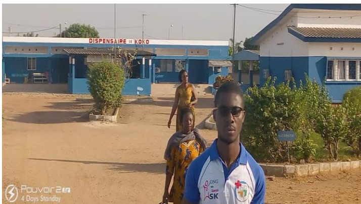
Coordinateur d'activité pour la mise en place