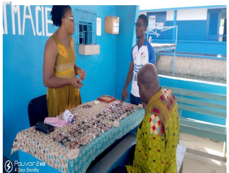
Entretien avec l'opticienne