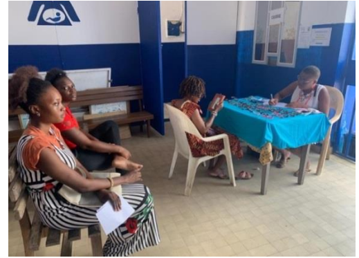
Entretien avec l'opticienne