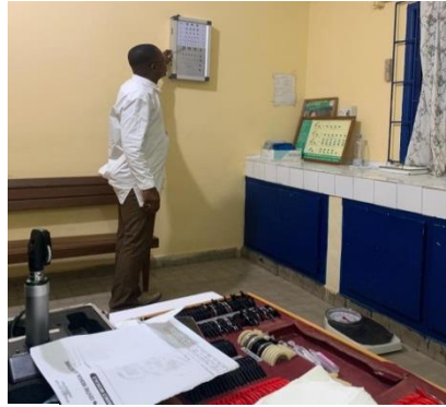
Médecin en consultation