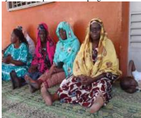
plaidoyer avec les femmes