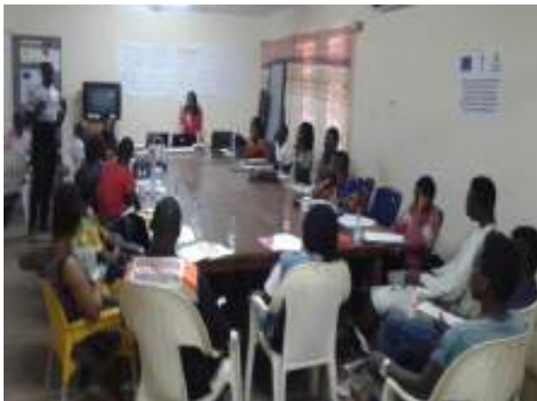
Le 29 octobre à Bouaké