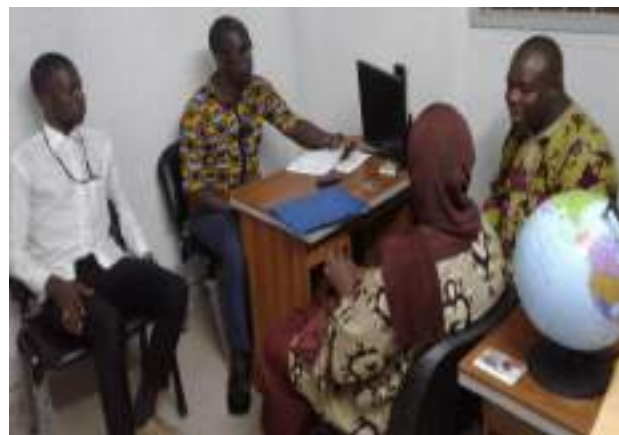
Plaidoyer à Alliance FM

Le siège social est à Bouaké au quartier Belle Ville 2, derrière la pharmacie, lot N°709 bis îlot 76