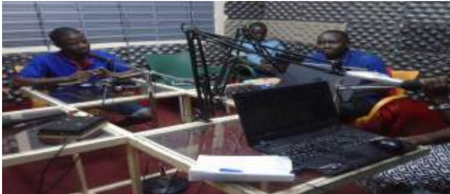
Images pendant des émissions Radiophonique de sensibilisation