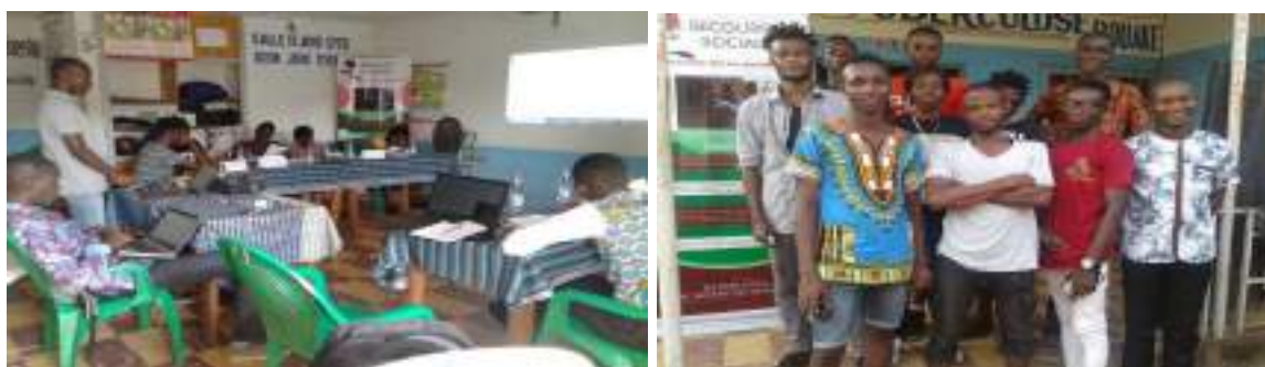
Photo de la session d'orientation des 10 pairs éducateurs, sur les stratégies de sécurité et de soutien aux personnes LGBTI victimes de rejet.

La session d'orientation, financée par RAINBOW SOLIDARITE sous l'égide de Fondation de France s'est tenu les 16 et 17 mars 2019, a connu la participation des dix (10) pairs éducateurs