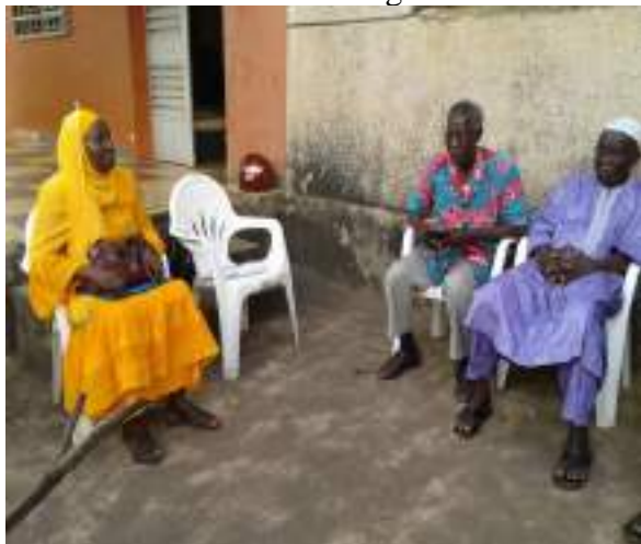
Plaidoyer avec les hommes