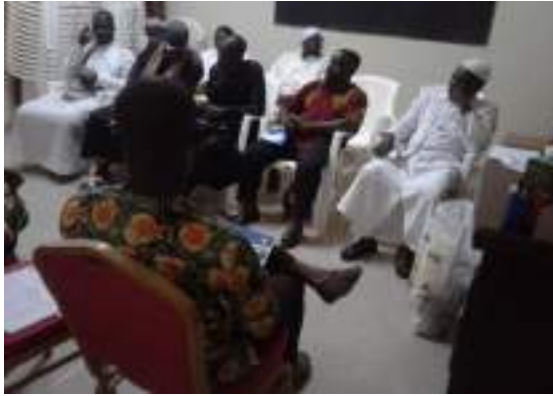
Forum des confessions religieuses