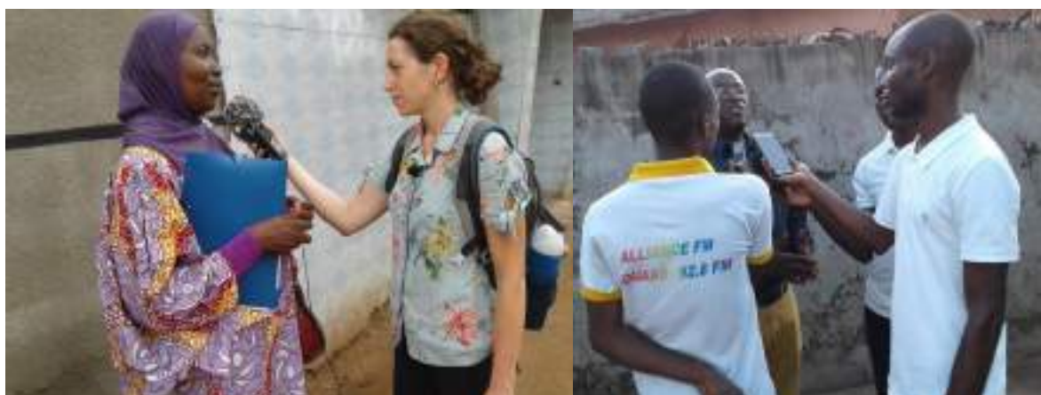
Le siège social est à Bouaké au quartier Belle Ville 2, derrière la pharmacie, lot N°709 bis îlot 76

Sur financement de Rainbow Solidarité et grâce à nos actions de plaidoyers, nous avons réalisés dix (10) émissions radios et dix (10) reportages lors de nos activités. Il était question de sensibiliser la population de la ville de Bouaké à travers les radios sur la thématique des populations clés, d'autres fois sur le lien indissociable de la violation des droits des populations clés et la propagation de l'infection à VIH.