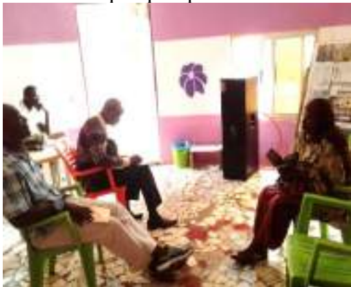
Plaidoyer à Fréquence Vie

Ci-dessous quelques photos des visites de plaidoyers :