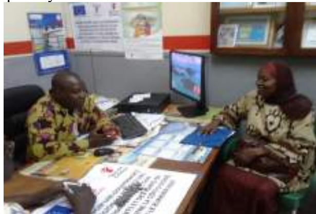
Plaidoyer à Média+