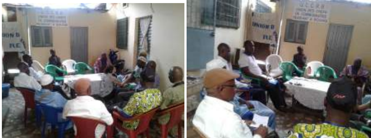
Séance de plaidoyer avec les chefs de communauté.

Ci-dessus quelques photos de la visite de plaidoyers