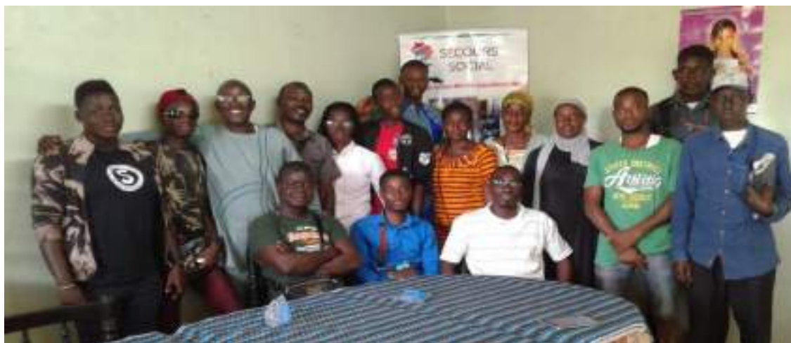
Photo de famille avec l'union nationale des journalistes et correspondants de Côte d'Ivoire après une table ronde.