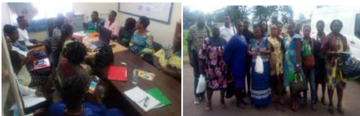
Le 31 octobre à Yamoussoukro