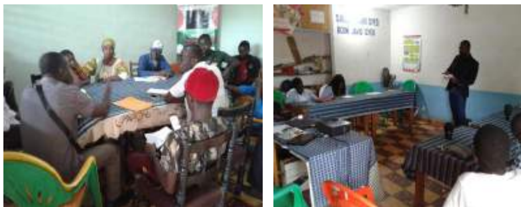
Photos de séance de table ronde avec les hommes de média de Bouaké.

Le siège social est à Bouaké au quartier Belle Ville 2, derrière la pharmacie, lot N°709 bis îlot 76