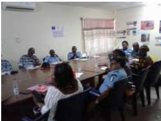
Le 30 octobre 2019 à Bouaké