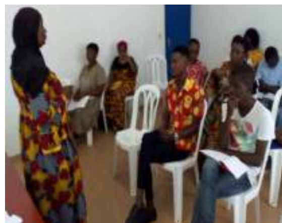
le 31 octobre 2019 à Yamoussoukro.