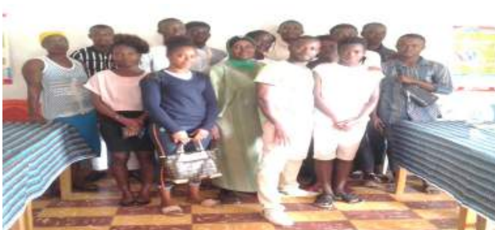
Image après une table ronde avec les étudiants de l'Université Alassane Ouattara de Bouaké.