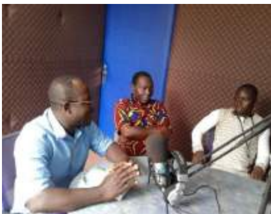
Plaidoyer à Saphir