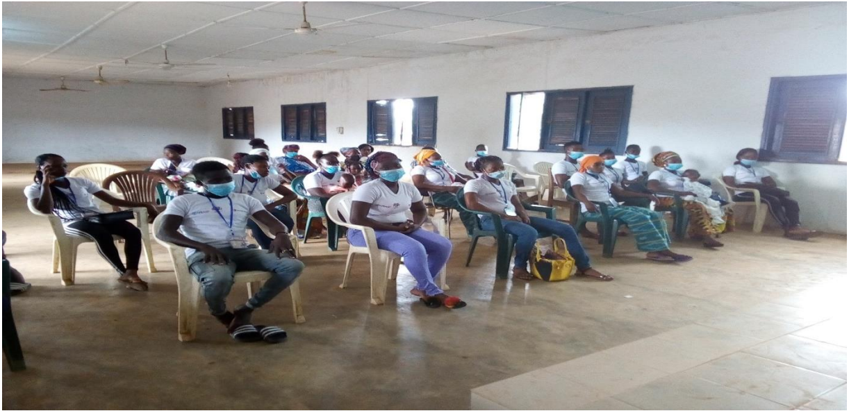
VISITE GUIDEE DES PARTICIPANTS AUX ACTIVITES DE CCV A KOUN-FAO