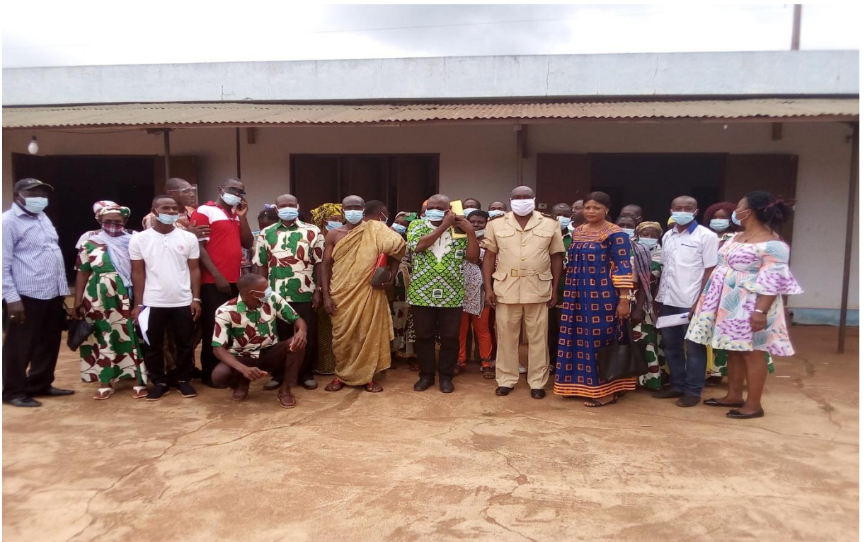
PARTAGE AVEC (Association Villageoise d'Epargne et de Cr dit)