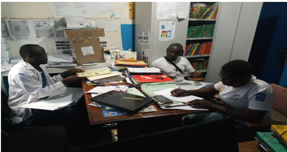
SEANCE DE SUPERVISION DES CONSEILLERS COMMUNAUTAIRES DE HG TRANSUA