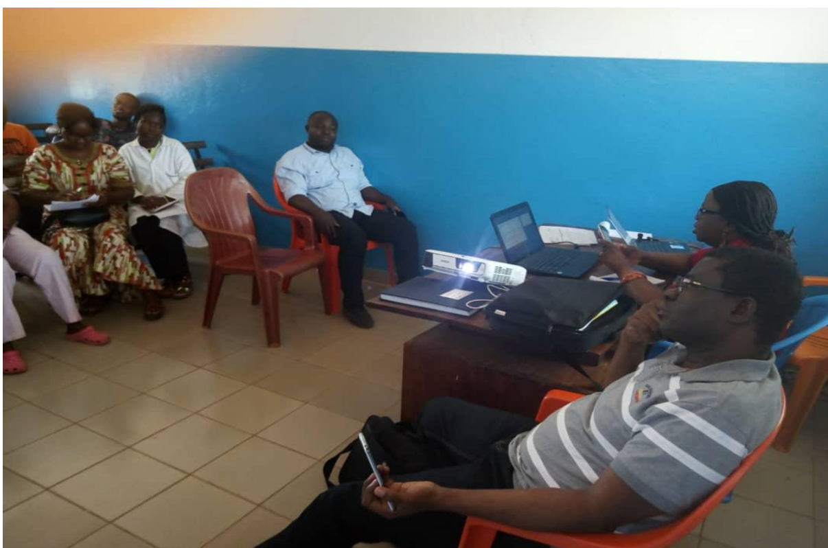
ATELIER DE RENFORCEMENT DE CAPACITE DES PRESCRIPTEURS LES NOUVELLES DIRECTIVE DU TLD ANIME PAR LE PNLS