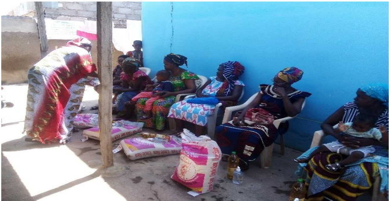
DISTRIBUTION DES KITS ALIMENTAIRES (RIZ, HUILE) ET KITS HYGIÉNIQUE (GEL HYDRO ALCOOLIQUE ET DE CACHE-NEZ)