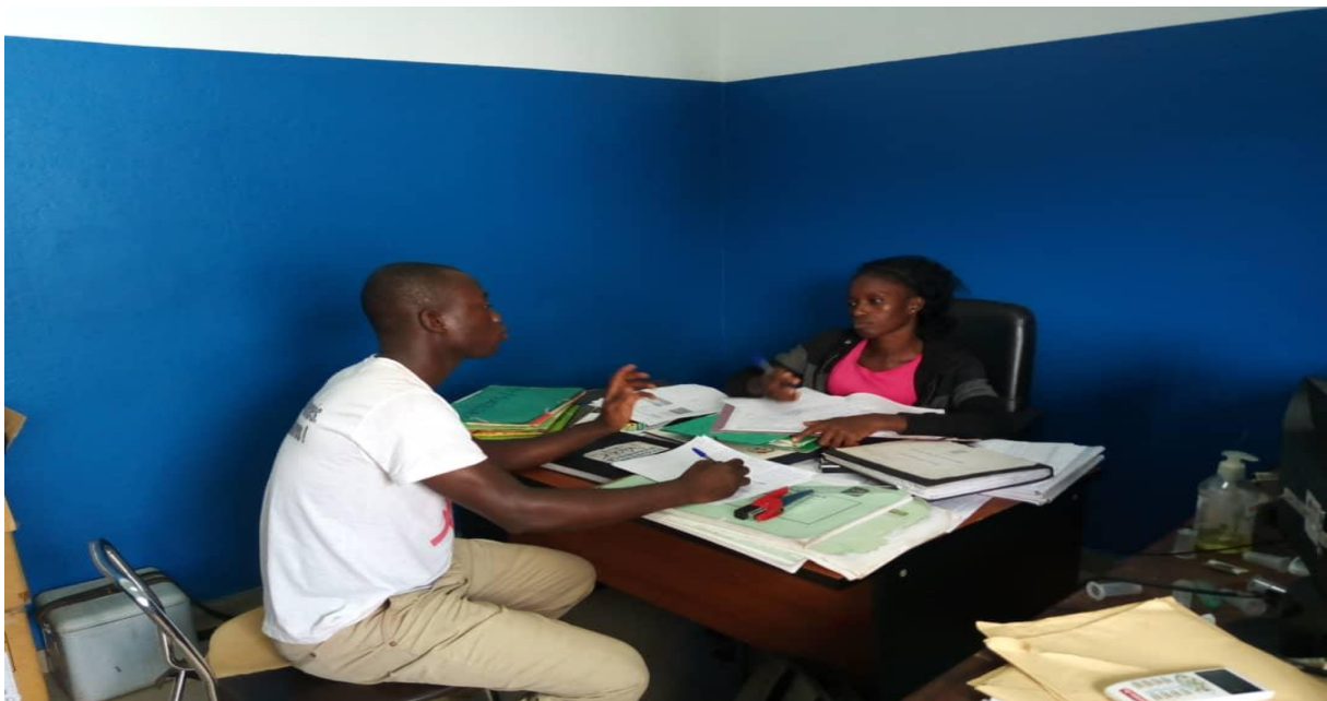
SEANCE DE MONITORAGE DE DONNEES SUR LE SITE DU CSU KOUASSI-DATEKRO