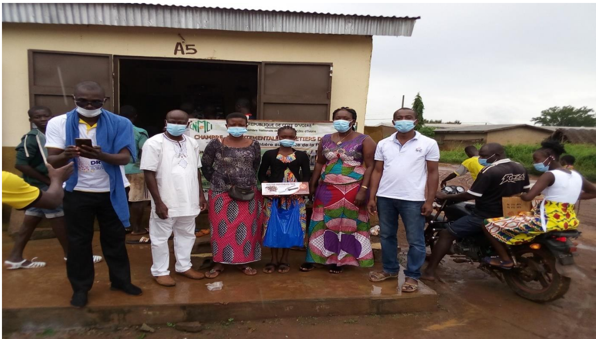
REMISE DE KITS D'APPRENTISSAGE AUX BENEFICIAIRES DE KOUNFAO