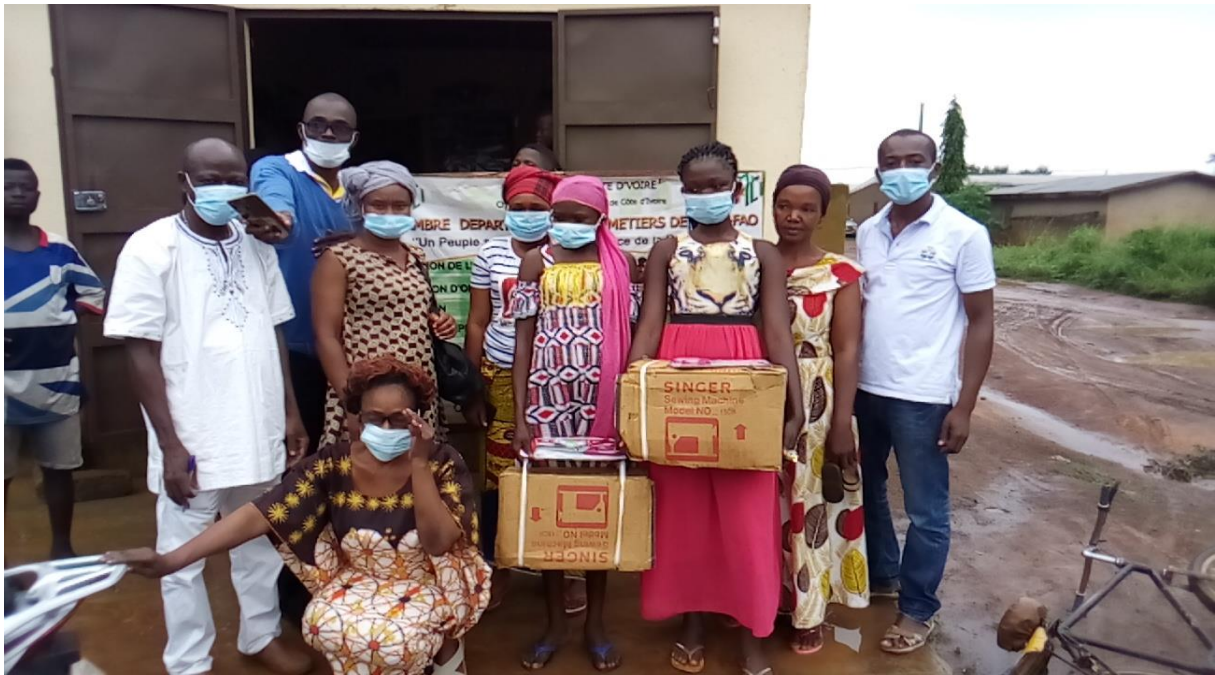
REMISE DE KITS D'APPRENTISSAGE AUX BENEFICIAIRES DE KOUNFAO