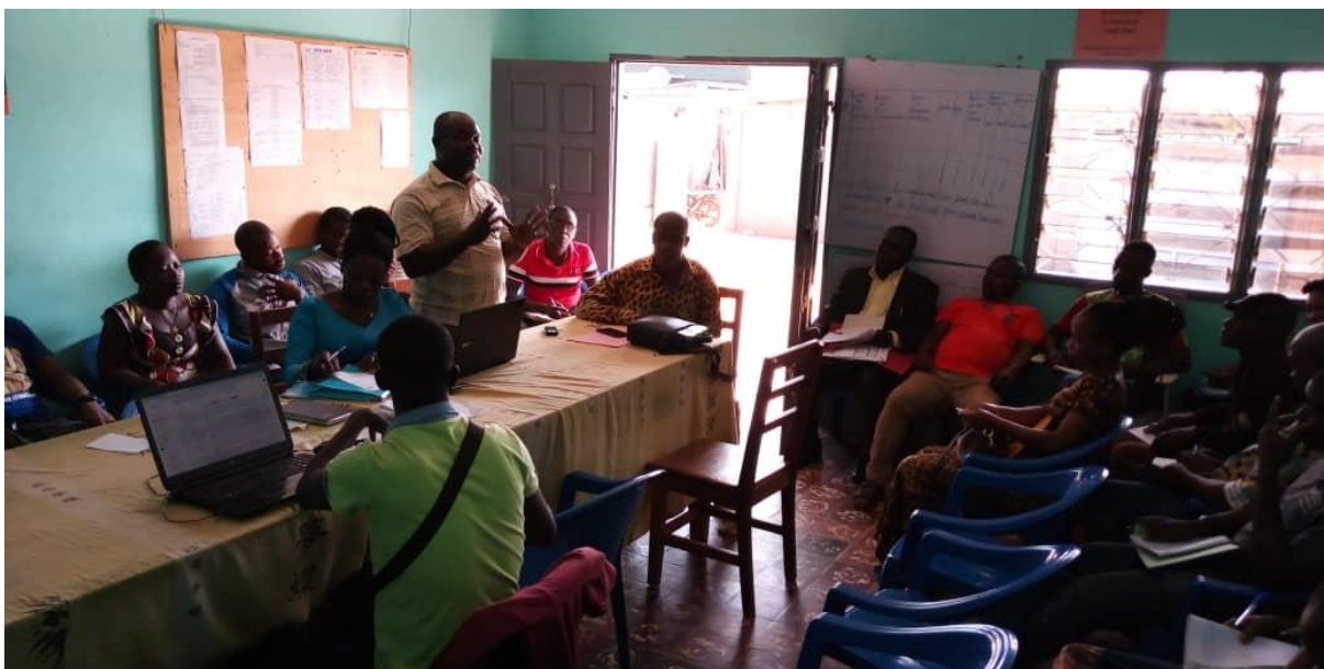
REUNION DE COORDINATION